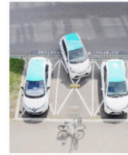
bicyclette à Lyon (en haut) Application Klaxit et Flotte Citiz (en bas)