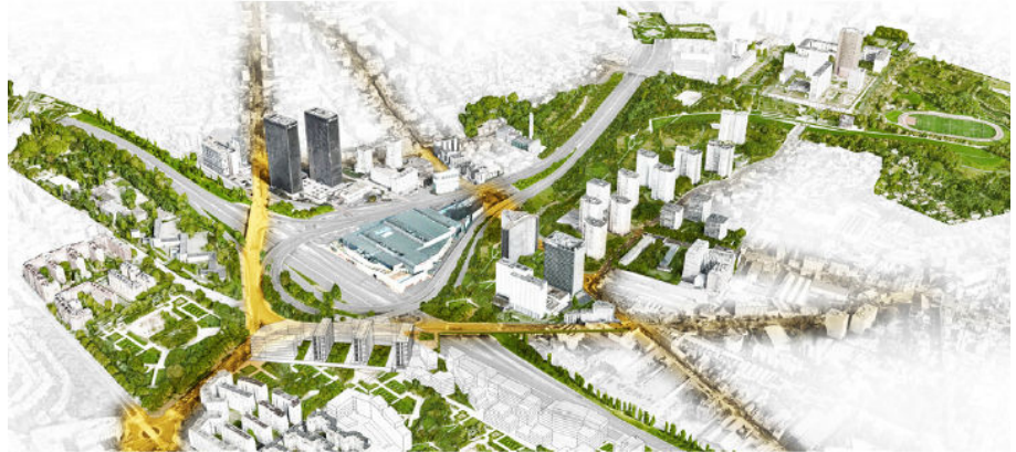
↑ Une trame verte connectée

La Porte de Bagnolet aujourd'hui, un nœud complexe d'infrastructures et des trames paysagères et urbaines à reconstituer